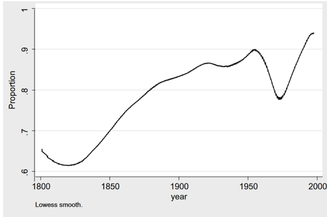
FIGURE 3.1 Proportion of countries with legislatures.