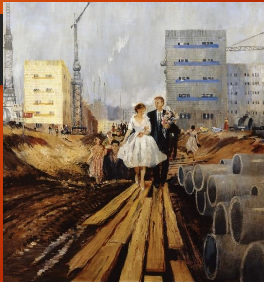
Юрий Пименов «Свадьба на завтрашней улице», 1962 Собрание Государственной Третьяковской галереи